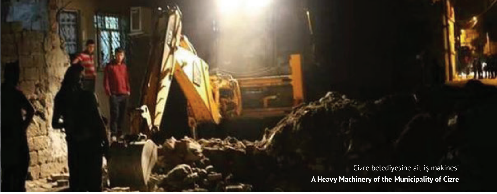
Cizre belediyesine ait iş makinesi A Heavy Machinery of the Municipality of Cizre